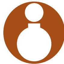
انجمن هنرمندان سفالگر ایران