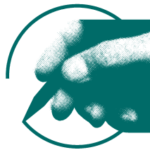
انجمن صنفی طراحان گرافیک ایران